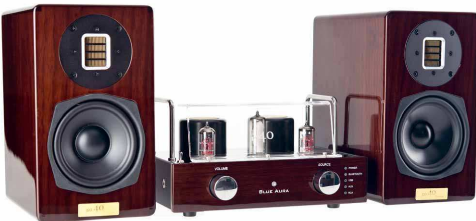
Die Blue Aura PS40 LE und V40 LE bieten ein edles Outfit dank echten Hölzern und hervorragender Hochglanzlackierung

Lautsprecher PS40 LE Passend zum Röhren-Verstärker V40 LE bietet Blue Aura mit den PS40 LE zwei wunderschöne Regallautsprecher an. Diese rund 15 Zentimeter breiten und 253 Millimeter hohen 2-Wege-Lautsprecher wissen durch ihr edles Walnuss-Furnier und erstklassig lackierte Oberfläche zu gefallen. In der neuen LE Version wurde das Gehäusevolumen minimal vergrößert, was für eine noch sattere Basswiedergabe sorgt. Für anspruchsvolle Musikwiedergabe wurde ein Tief-mitteltöner mit einer faserverstärkten 95-mm Membran sowie ein Air-Motion-Transformer (AMT) eingesetzt, der gegenüber der 25-mm Kalotte der alten Version für noch feiner auflösende Hochtönerwiedergabe sorgt. Auch die Rückseite der PS40 LE belegt mit soliden, vergoldeten Schraubklemmen die gute Verarbeitungsqualität der rund 3,5 Kilogramm schweren Regallautsprechers.